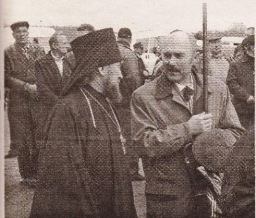
"А навіщо тут стільки партійних прапорів?"

пишатися тими, хто боровся та віддав своє життя за незалежність України, — йдеться у зверненні.