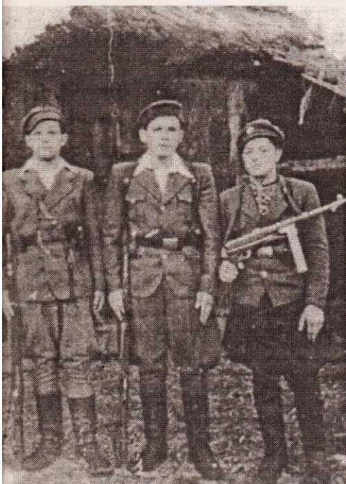
До лав УПА йшло багато молоді, яка вірила — Україна стане незалежною