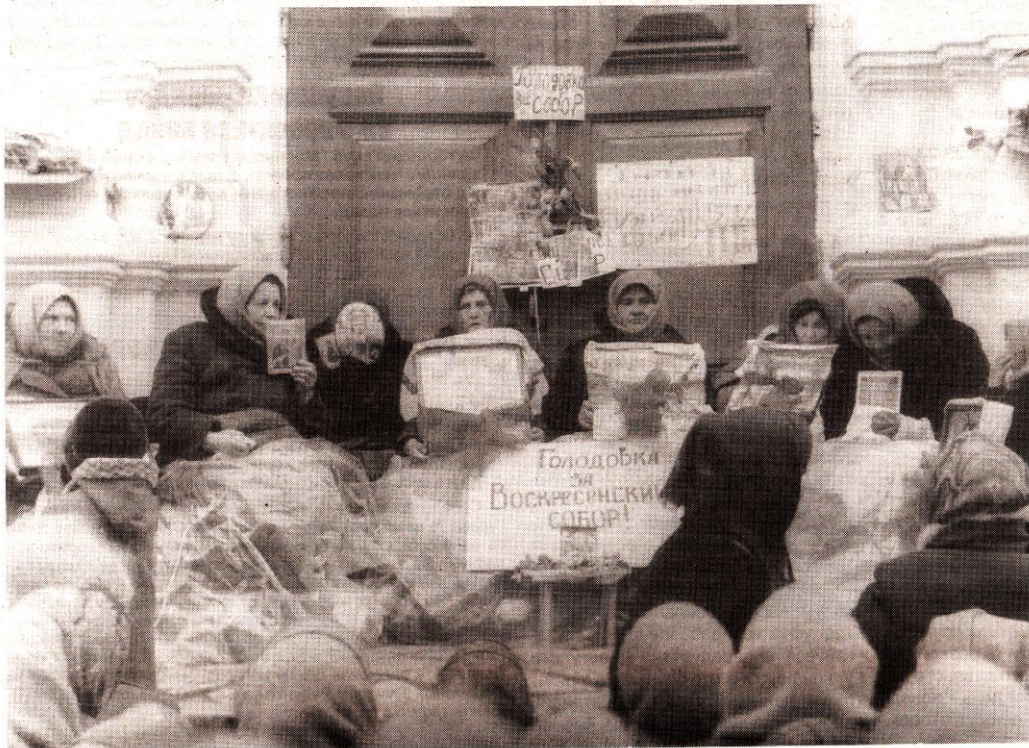
Голодування за Собор, 1989р

– Я ходила до школи у Бударажі, маю початкову освіту. Нас вчила тільки одна вчителька, бо учнів було лише двадцять. Вона приділяла достатньо уваги кожному. Чому могла, тому й навчила, а далі вчилу життя. А пово-