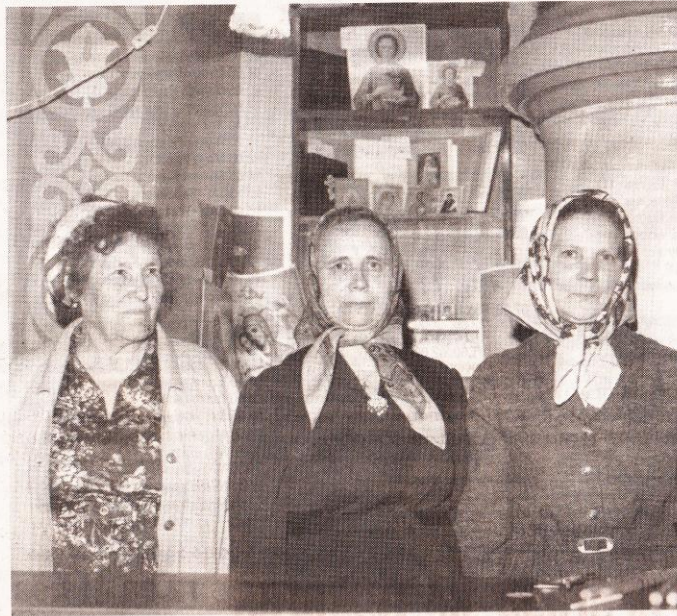
У Свято-Воскресенському Соборі