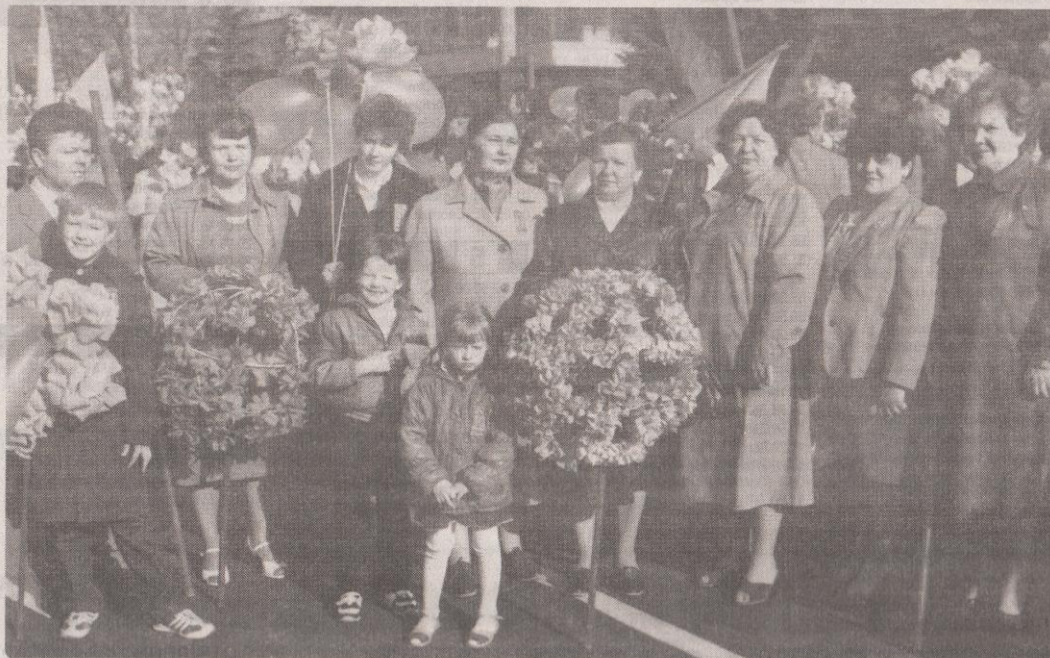
На параді, швейний цех, 1988р.

– Згадую ті важкі повоєнні роки: не було що їсти і лягнути теж не було у що. За хлібом стояли у черзі