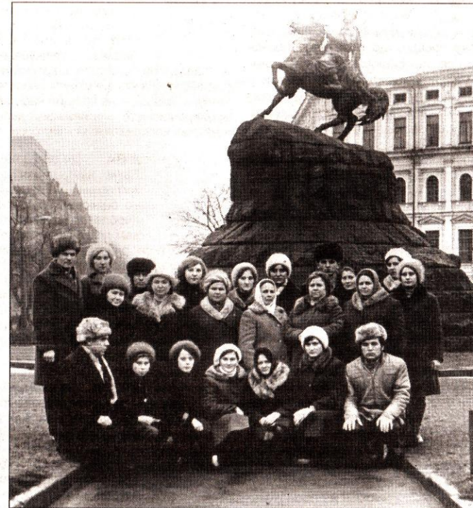
На екскурсії в Києві, 1979р.