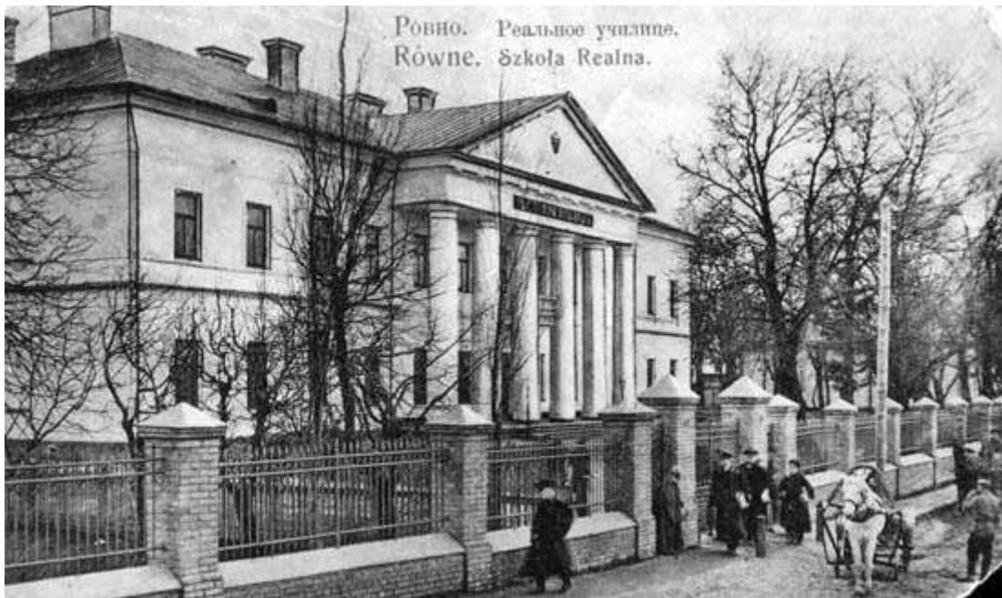
Гімназія (вона ж – реальне училище), листівка початку ХХ століття

Загалом життя спудеїв у кінці 19-го століття було бідним на цікаве дозвілля. Великим гімназійним святом були акти випуску, які влаштовувалися щоліта. Цих урочистостей гімназисти чекали особливо. Адже нарешті можна було поїхати додому й провести літо в родині. Власне, трохи вольностей спудеї могли собі дозволити саме під час канікул. На Різдво гімназисти ходили цілими ватагами колядувати, на Великдень – влаштовували вилазки на природу. Урізноманітнювали життя гімназистів й видовища на кшталт участі у "масовці" з нагоди приїзду до міста сановитих гостей – царського міністра освіти Норова, Київського та Волинського генерал-губернаторів. Удостоїлися рівненські гімназисти зустрічати й самого імператора. У 1857 році вони вітали Олександра II при в'їзді до міста, спостерігаючи потім цілу ніч вогні та феєрверки на його честь. А 2-го вересня 1888 року вишикувані на залізничному вокзалі гімназисти вітали колективним "ура!" імператора, який із сім'єю проїжджав через Рівне.