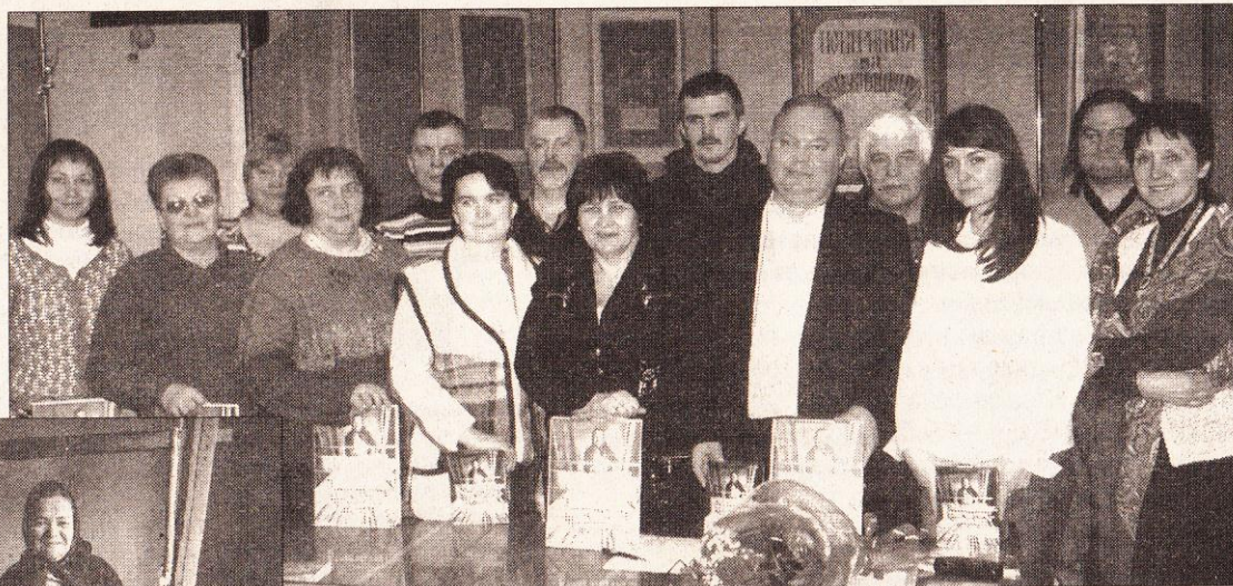
Автори «Етнокультури Рівненського Полісся».

дарній та родинній обрядовості, громадському побуту та звичаям, що супроводжували поліщуків усе їхнє життя. Вміщено матеріали про народне будівництво, промисли, народний одяг, традиції харчування, народну медицину та народний іконопис. Музичну частину представляють описи регіональних особливостей народної пісенної творчості, інструментальної музики та танцювальної культури. Описовий матеріал доповнює-