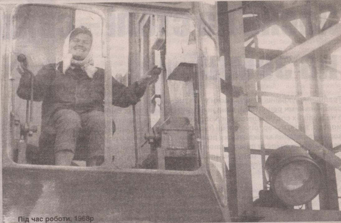
Під час роботи. 1968р