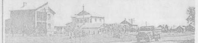
Вулиця новобудов у Пасіках іде в напрямку Козина.