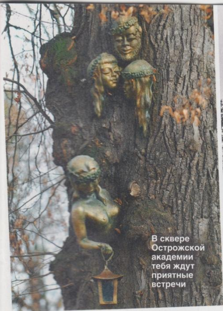
В сквере Острожской академии тебя ждут приятные встречи