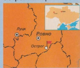
Текст: Елена Романенко