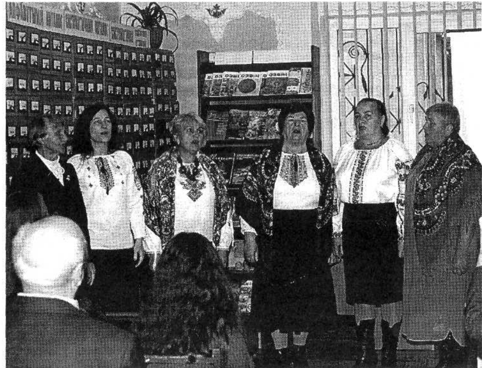
Під час родинного свята в центральній районній бібліотеці