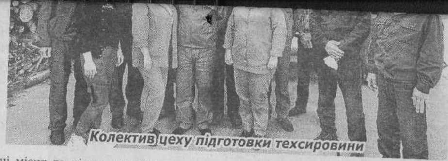
Колектив цеху підготовки техсировини

Більше 70 років Костопільський деревообробний комбінат, а нині ТОВ «Свиспан Лімітед», здійснює вагомий вплив на всі сфери життєдіяльності Костопільщини. Це і розвиток інфраструктури, особливо транспортного та меблевого сектору, і створення робочих місць, і сумлінна сплата податків до державного та місцевого бюджетів. Сьогодні «Свиспан Лімітед» – це потужний виробник деревостружкових плит, продукція якого реалізується у понад 15 країнах світу. Загалом колектив ком-