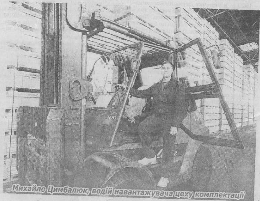
Михайло Цимбалюк, водій навантажувача цеху комплектації