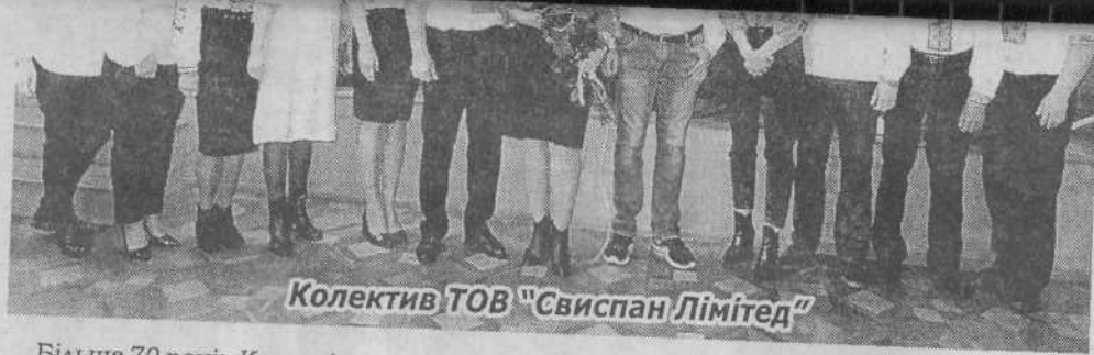
Колектив ТОВ "Свиспан Лімітед"