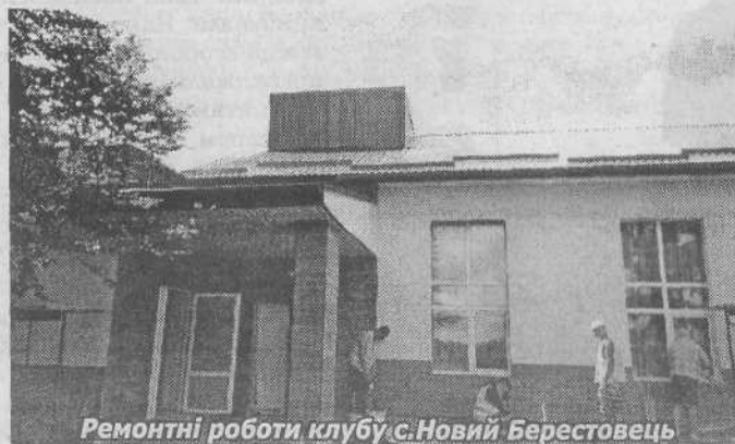
Ремонтні роботи клубу с.Новий Берестовець