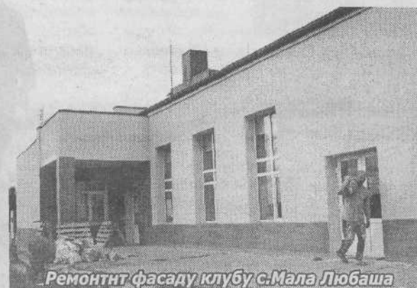
Ремонт фасаду клубу с.Мала Любаша