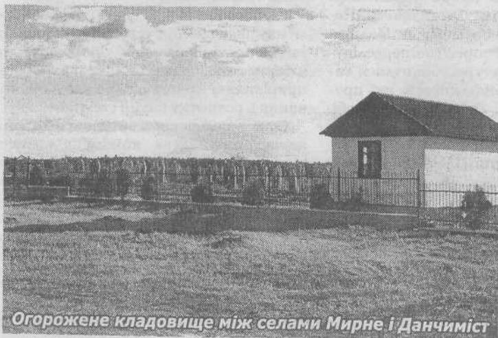
Огороджене кладовище між селами Мирне і Данчиміст