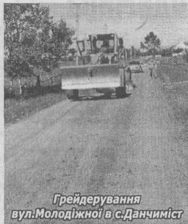
Грейдерування вул.Молодіжної в с.Данчиміст

Почну з благоустрою, адже це одне з основних питань, яке турбує сільського жителя. Запитаєте, чому? А тому, що благоустрій – це той елемент життя, який врівноважує село і місто. Людина, яка виходить зі свого будинку, повинна йти далі не