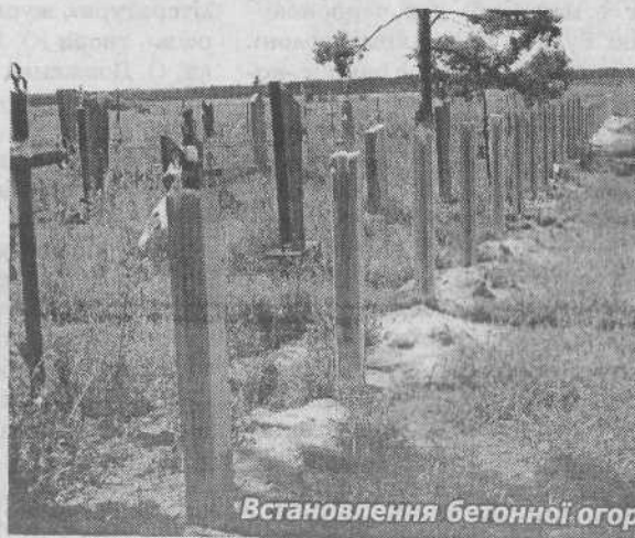
Встановлення бетонної огорожі на кладовищі в с.Глажева