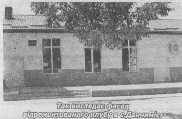
Так виглядає фасад відремонтованого клубу в с.Данчиміст

Одне слово, ми робимо все для того, щоб у наших закладах культури розвивали свої художні та мистецькі здібності як діти, так і дорослі учасники наших фольклорних колективів. Нам дуже приємно, що такі колективи є майже в кожному селі, а в Мирному маємо їх аж три - народний аматорський хор, народний аматорський вокальний гурт української пісні «Мирнівчани» та зразковий дитячий ансамбль народних музик.