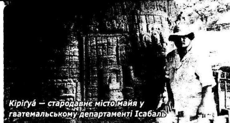
Кірігуа – стародавнє місто майя у гватемальському департаменті Ісабаль

"Не міг повірити, що буду головним спеціалістом з епіграфіки в Паленке і матиму доступ до всіх матеріалів розкопок за 100 років, що це буде в моїх руках! Навіть очікувати