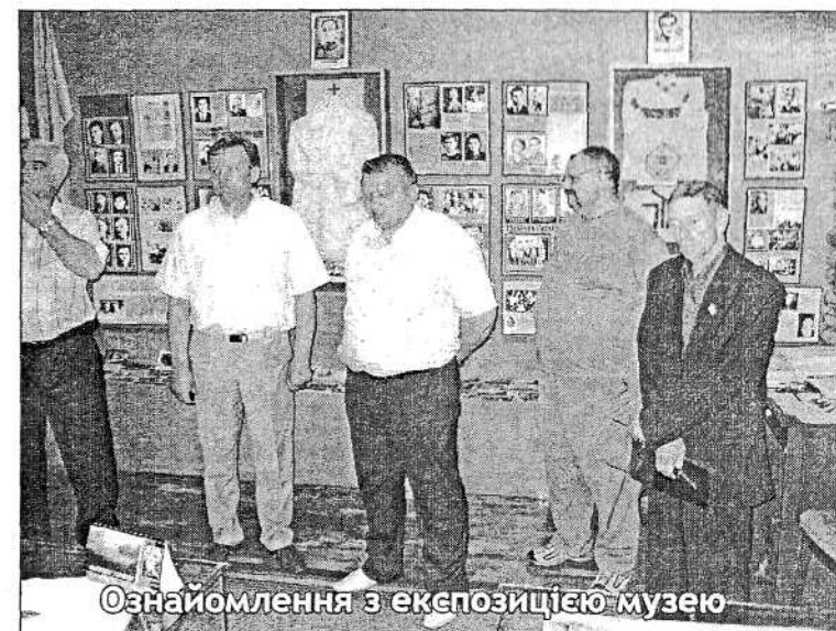
Ознайомлення з експозицією музею