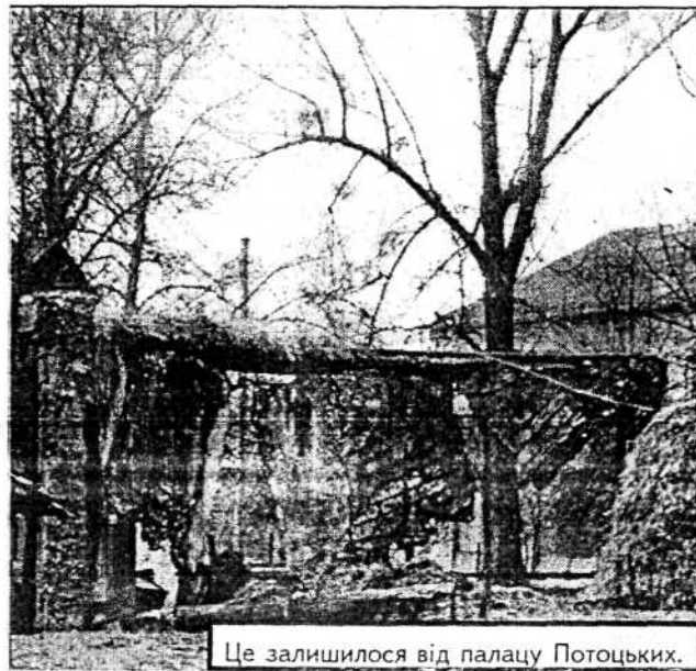
Це залишилося від палацу Потоцьких.