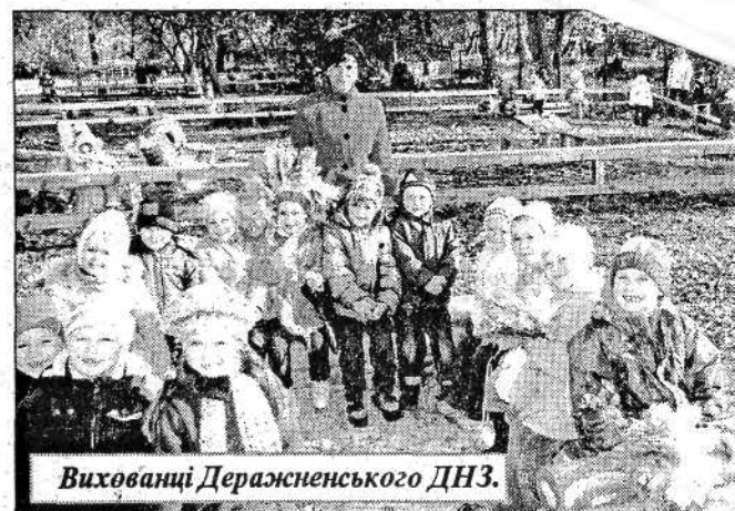
Вихованці Деражненського ДНЗ.