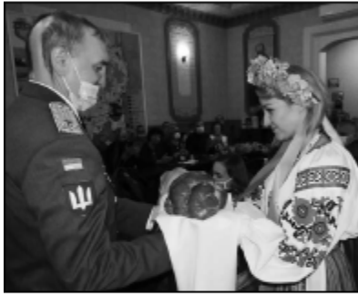
▲ За звичаєм родину Гордійчуків зустріли з хлібом-сіллю.

нин Кореччини» Гордійчуку Ігорю Володимировичу, начальнику Київського військового ліцею імені Івана Богуна, Герою України.