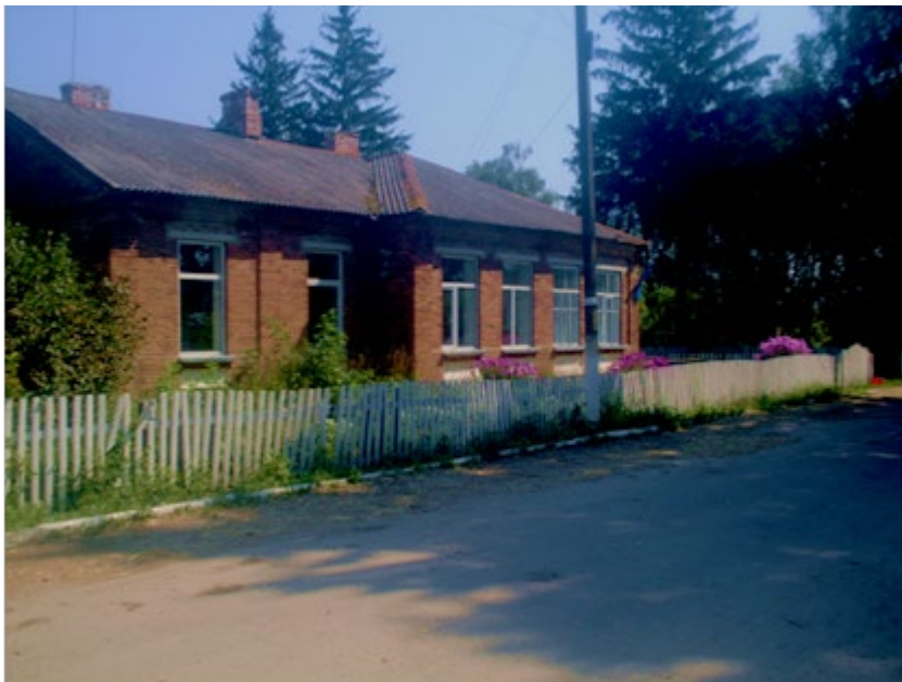
Сільська школа. XXI ст..