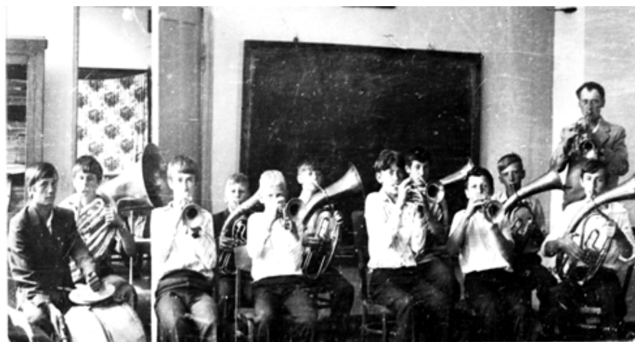
Шкільний духовий оркестр.