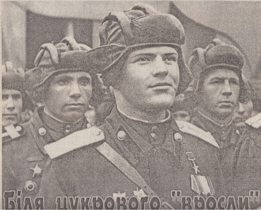
Біля цукрового "вросли"