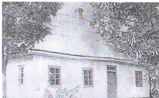
Перша початкова школа

У 1920 році за Ризьким мирним договором територія Самостріл відійшла до складу Польщі.