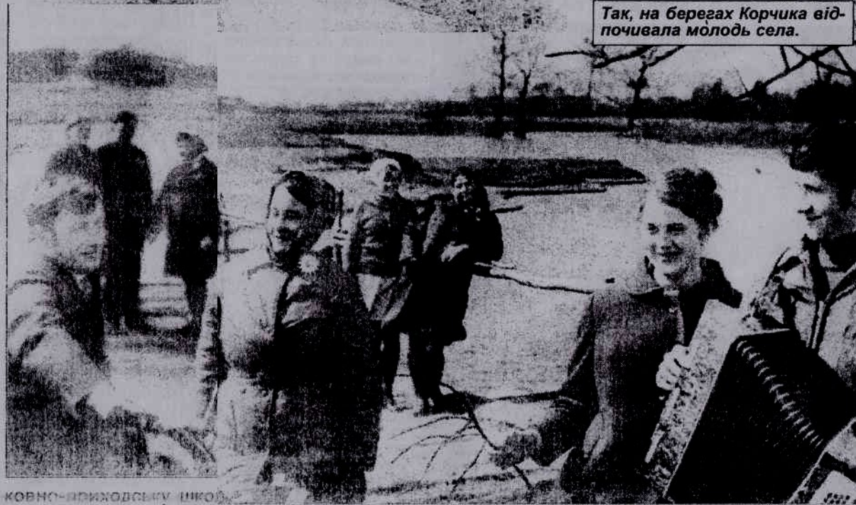
Так, на берегах Корчика відпочивала молодь села.

Частина села, що розташована за річкою Корчик, так і називається Заріччя. Крім того, до села прилягає хутір, на лівому березі Корчика понад шляхом до села Сторожів. Хутір виник на початку XX ст., коли в результаті Столипінської реформи мешканці села почали переселятися на свої земельні наділи і засновували там господарства. Селяни перебували в кріпосній залежності від поміщика