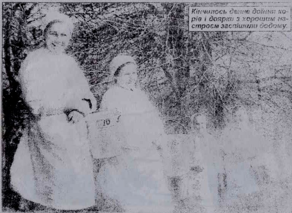
Кінчилиось бачити доїння корів і доярки з хорошим настроєм заспішили додому.

та 318 жінок. В 60-х роках XIX ст. землі села належали графині Марії Потоцькій, в 1864 р. вона відкрила цер-