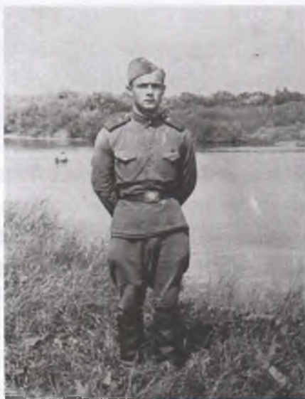
Я – солдат (1958 рік)

Нарешті прибули в кінцевий пункт, в селище Гродеково біля китайського кордону. В дорозі були 21 добу. Говорили хлопці, що мабуть будемо прикордонниками, але нас оприділили в мотострілецький полк, в піхоту. Коли спитали, хто грав на духових інструментах, то поскільки я грав на трубі в училищі, то мене записали в полковий муз взвод, але спочатку треба було пройти курс молодого бійця в піхотній роті.