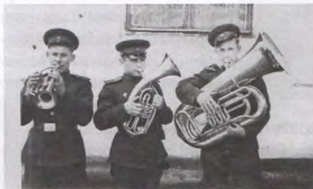
Я (в центрі) з улюбленим музінструментом альтом

З місяці довелось вчитись шикуватись, займатись стройовою ходьбою, озяблими пальцями виконувати команди «заряджай; цілься», лежачи на пронизливому вітрі, відчути, як в обличчя січуть мілкі камінці, схоплюватись о 6 годині ранку по команді «підйом», вибігати роздітими до пояса на мороз з вітром, робити фіззарядку, бігати. Коли вже прийняв присягу перевели мене до музикантів. Там життя було набагато краще: ганяли гами на трубах в класі-студії. Потім вчились муз грамоті, вивчали марші і інші мелодії, взагалі виконували все, що необхідно. Але настав день, коли надійшла команда готуватись до дислокації полка. За короткий строк полк з усією технікою – танками, гарматами та іншою зброєю і всім майном аж до маленького гвіздка був готовий до завантаження в ешелони. Сказали, що передислокуємось на відстань біля 300 кілометрів, ближче до Хабаровська. Особливо важко йшло завантаження танкового і артилерійського батальйонів. Розвантажились на маленькому полустанку села Сібучар, за два кілометри від станції, полк зайняв місце, яке раніше експлуатувала інша військова частина. Все було в жалюгідному стані, довелось обладнувати палаткове містечко, для музвзвода дали два намети. Потім на період ремонту казарм, полк відправили на військові маневри в сопки. Там пробули на маневрах до кінця літа. Коли повернулись в Сібучар і поселились в окремих будинок для оркестру, матрац, набитий соломкою і подушка з сіном, чисті простині здалися нам пуховиками.