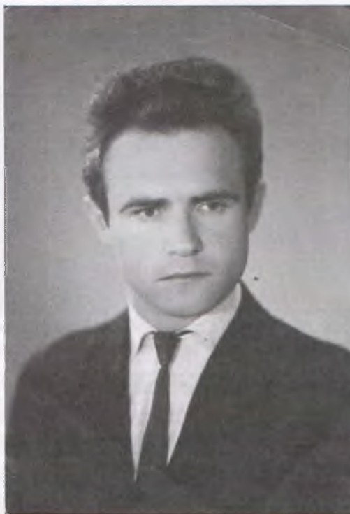
Студент інституту (1963 рік)