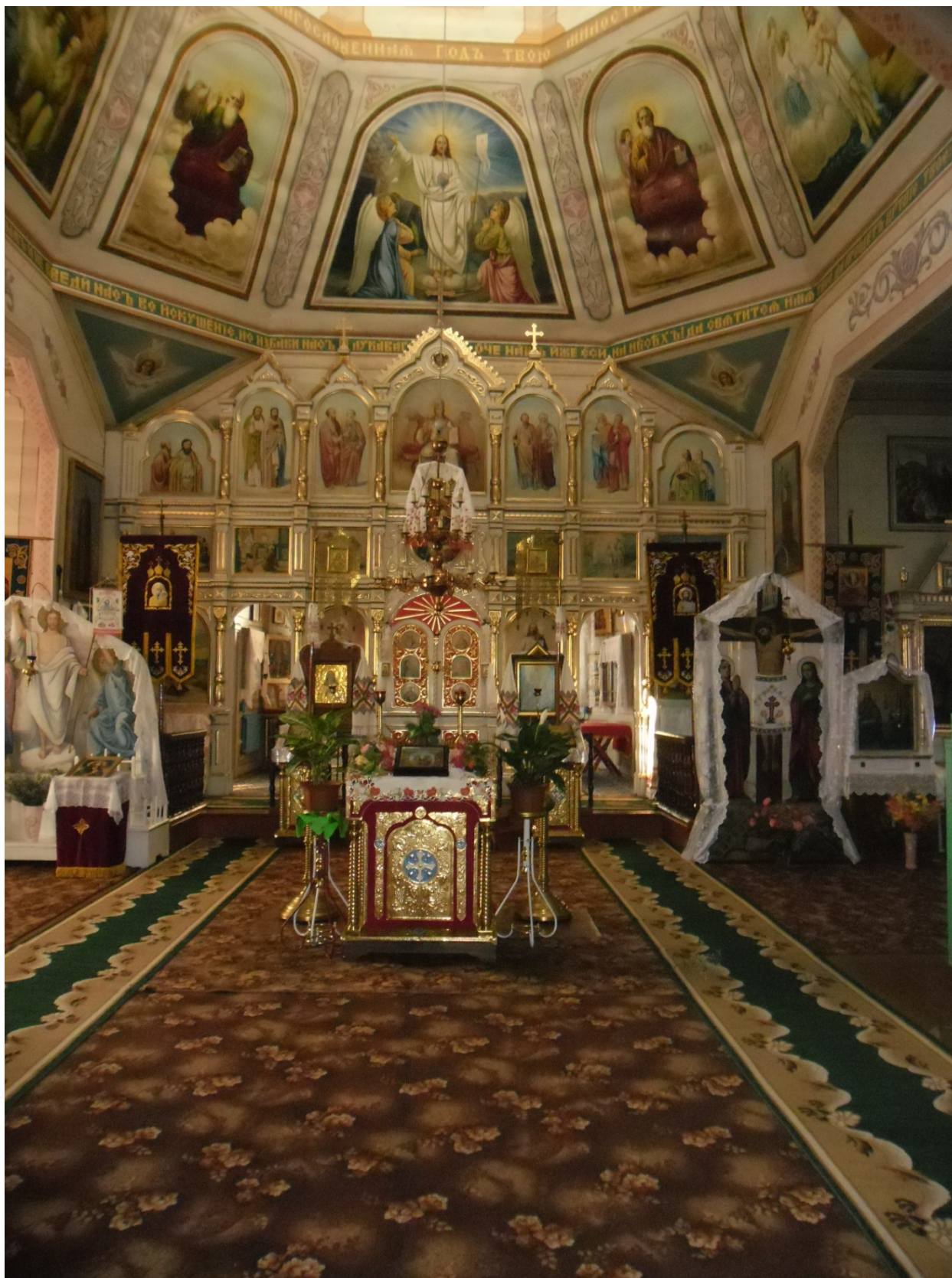
Зображення церкви в середині.