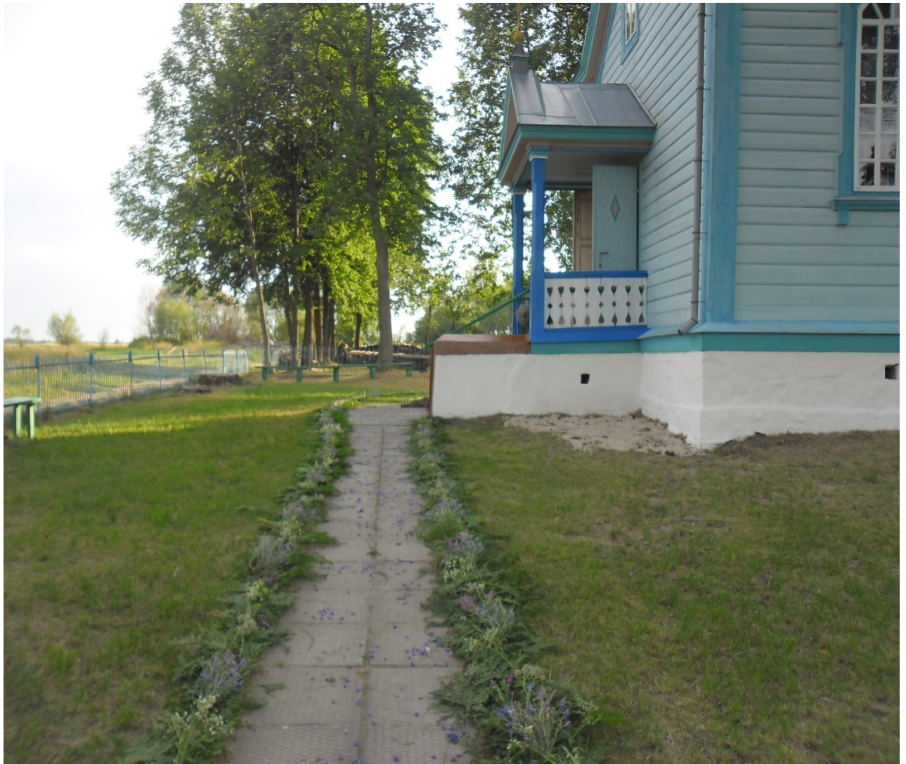
Зображення церкви зі входу.