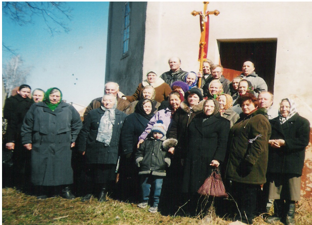
Учасники хресної дороги

(охоронний номер 601-11) який став духовним центром християн-католиків. Божа Служба в костелі проводиться по неділях о 11-й годині, почергово українською та польською мовами.