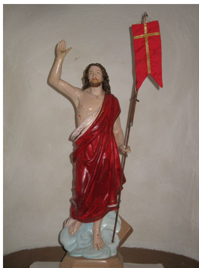
Скульптура Ісуса Воскреслого