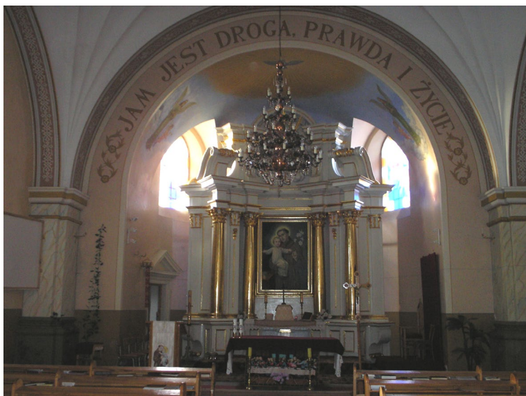
Вівтар Святого Антонія