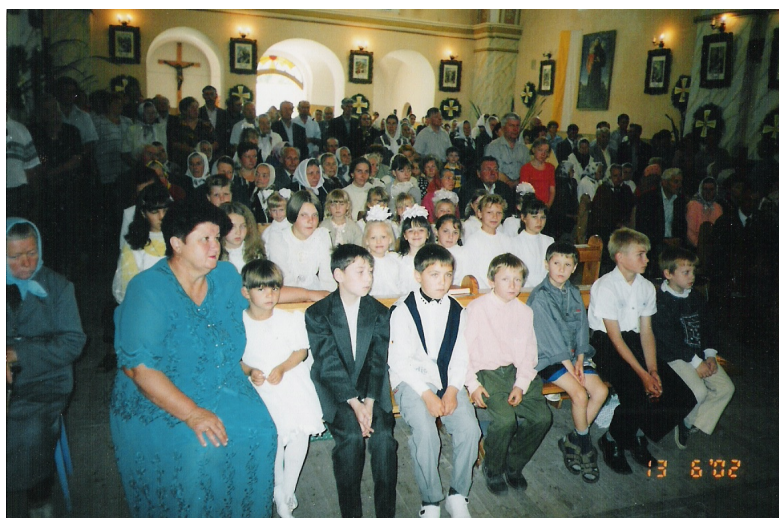
Завжди людно в костелі на святі Святого Антонія