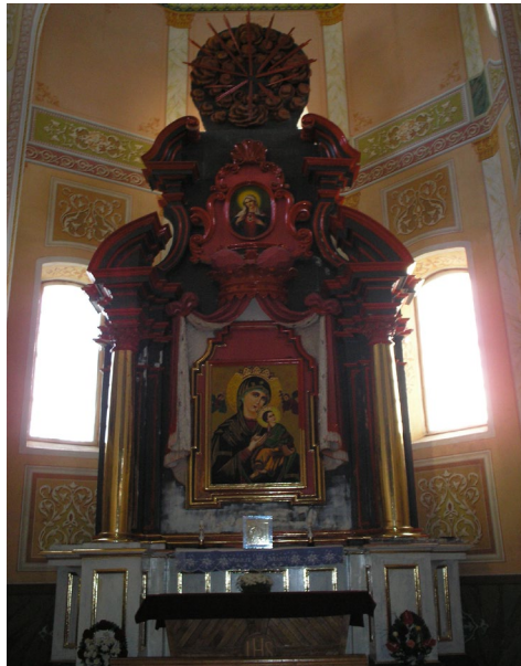
Вівтар матері Божої Неустанної допомоги

Бічна каплиця – це давня крухта з криволінійним фронтоном. Над склепінням нав здіймається висока двохкондигнаційна сигнатурка.