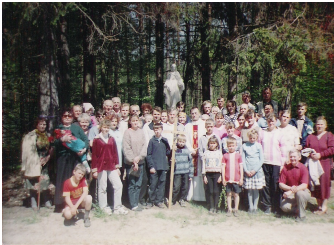
На молитві до Матері Божої в Сторожівському лісі