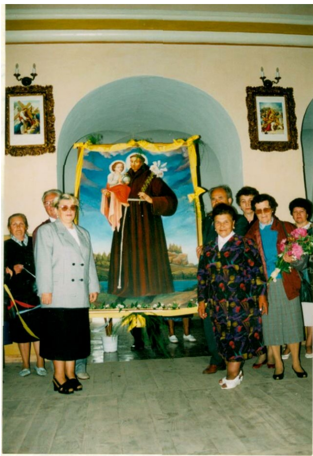
Делегація м. Валч 1994 р.

В червні 1994 року делегація з м. Валч ( Польща) (куди в 1945 році переселилися поляки з Корця і вивезли образ Святого Антонія) подарували копію ікони Святого Антонія, яку було встановлено в костелі.