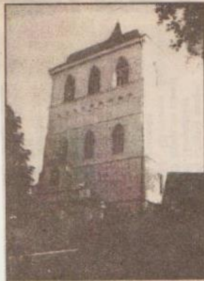
Багато дослідників сходяться на думці, що в цій вежі свого часу діяла друкарня.

ітектури» поряд з Афінським Акрополем, собором Паризької Богоматері та київською Софією. Такої честі, як стверджують спеціалісти, сільська