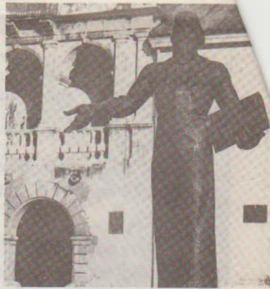
Пам'ятник Івану Федорову у Львові.

Після смерті Костянтина Острозького в житті Дерманського монастиря настають зміни. Відтепер він опиняється під патронатом людей, які більше не опікувались православ'ям. Щоправда, Януш Костянтинович Острозький на прохання І. Балабана захищає майнові права монастиря й забороняє своїм урядникам примушувати селян до сторонніх робіт. Найпізніший виявлений документ про перебування І. Балабана на посаді дерманського