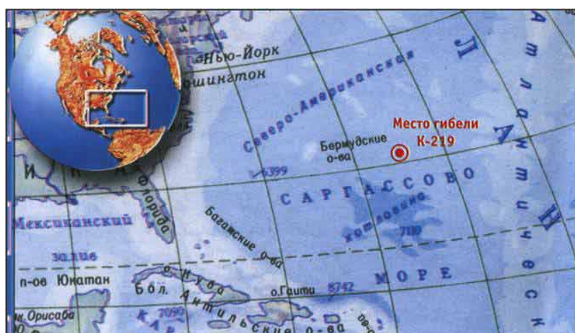
Місце аварії АПЧ К-219 на карті