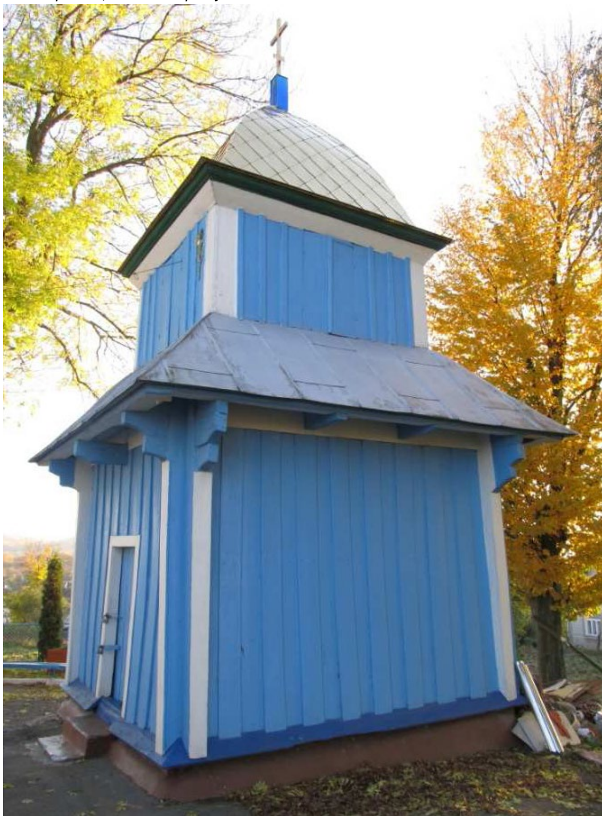
біля мирогощанського храму