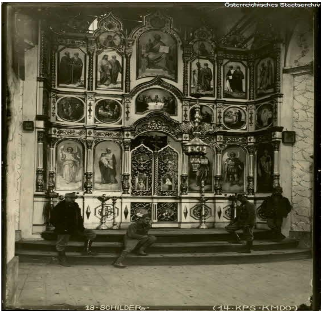
Віттар в церкві Святого Миколая в Дублянах, 1915 р.