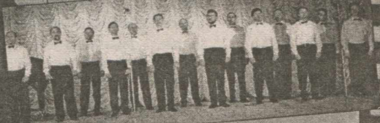
Чоловічий вокальний ансамбль лікарів.