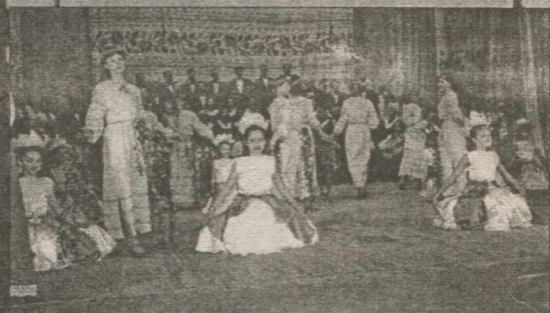
Композиція «Край над Іквою».