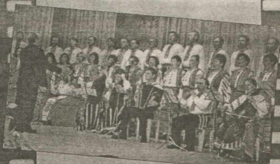
Аматорський народний хор районного центру дозвілля.