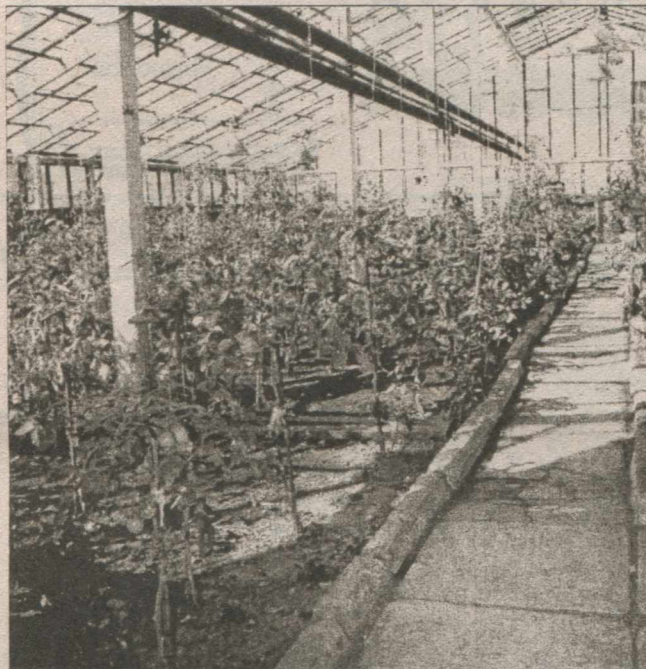
Теплиця в «Агротехсервісі» виглядає як оазис благополуччя. Колишнього...