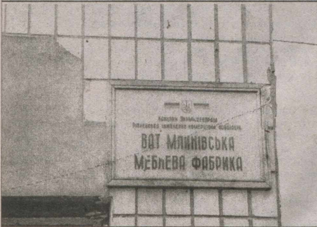
Яка плитка, така і візитка.

ЧОМУ КОЛИСЬ МЛІНІВСЬКИМИ ШАФАМИ ТІШИЛИСЬ НАВІТЬ УЗБЕКИ, А ТЕПЕР ВОНИ НІКОГО НЕ ТІШАТЬ