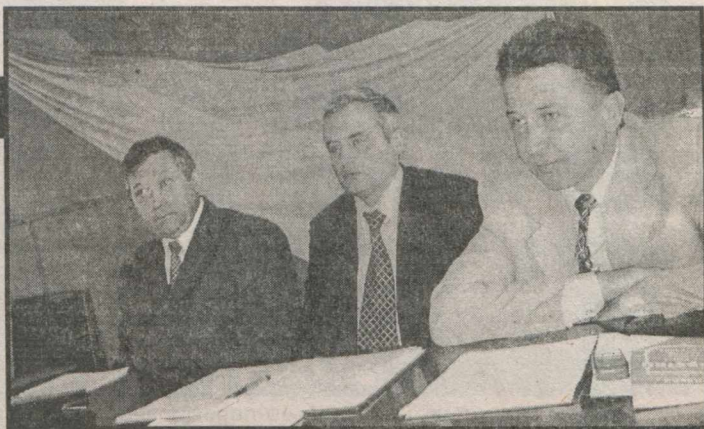
На фото: під час засідання колегиї.

У сфері працевлаштування позитивні тенденції і в інших сферах діяльності. У сфері працевлаштування позитивні тенденції і в інших сферах діяльності.