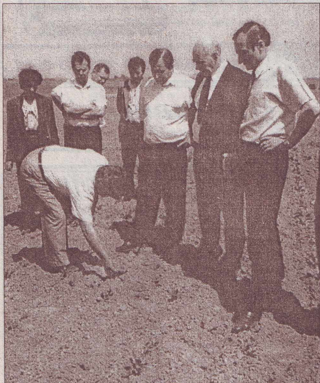
Спробуй знайди бур'яни на буряковому полі "Прогресу".