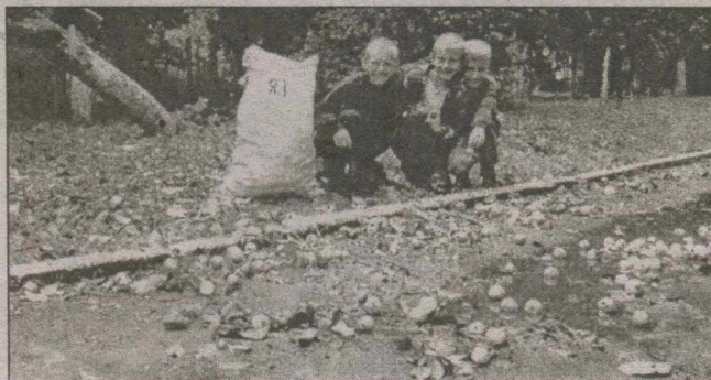
Яблучко від яблуні... далі тротуару не покотиться

Зрозуміло, що втрату виробничого потенціалу було чимось компенсувати. У тодішньому райкомі партії поставили питання про переорієнтування виробництва. Пригадуєте: згідно з парт-