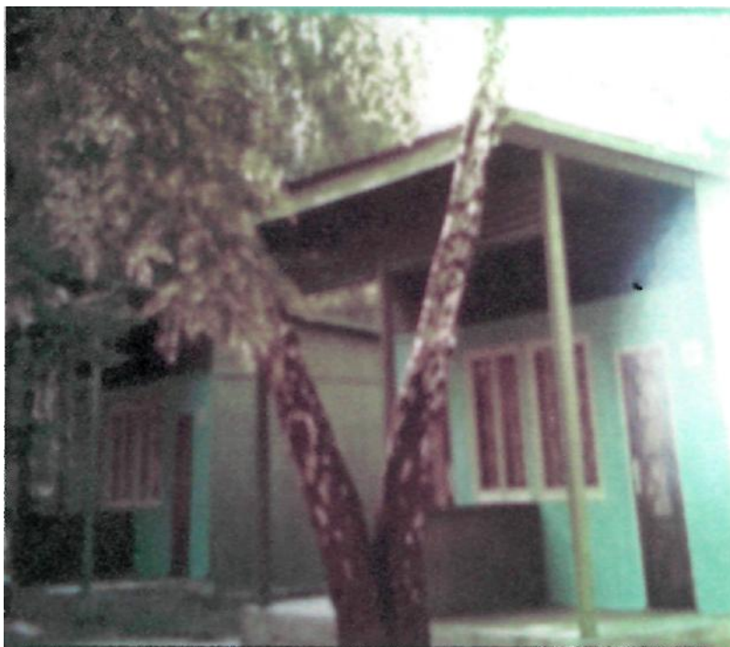
Зона оздоровлення РАЕС

Чиста, прозора вода в озері. Багата дуже на гліцерин, що на очах гоїть рани. жителі Відоме озеро як і місце відпочинку.