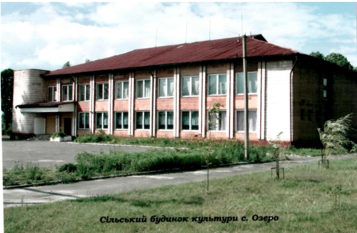
Сільський будинок культури с. Озеро