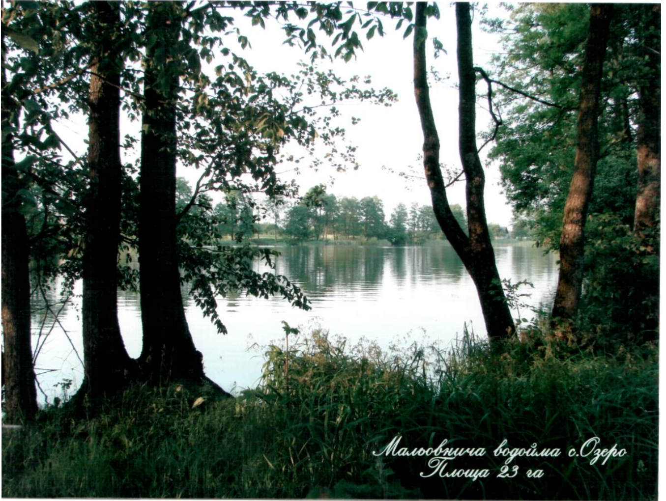
Малосвицка водойма с.Озеро Площа 23 га