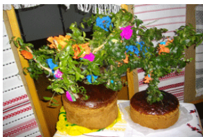
(Весільний коровай. Народні майстри Р. Рижа, Р. Кібиш, Є. Рижа)

Коровай, як обрядовий атрибут, має глибокі традиції, вирізняється багатоманітністю варіантів. Символ особливого значення, використовується у численних обрядових діях.