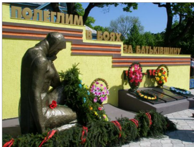
Пам'ятник полеглим в боях за батьківщину

У 1957 році Володимирець був віднесений до категорії селищ міського типу.