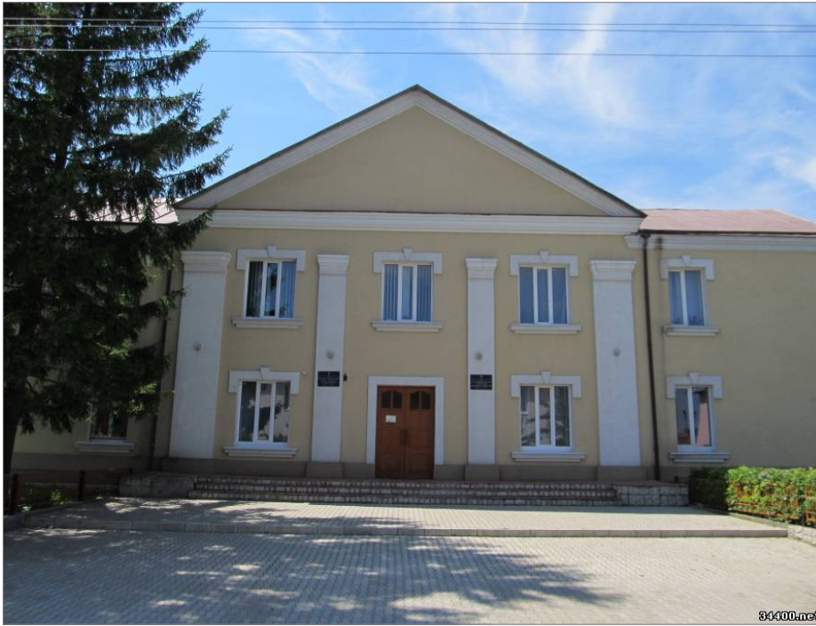
Районный будинок культуры