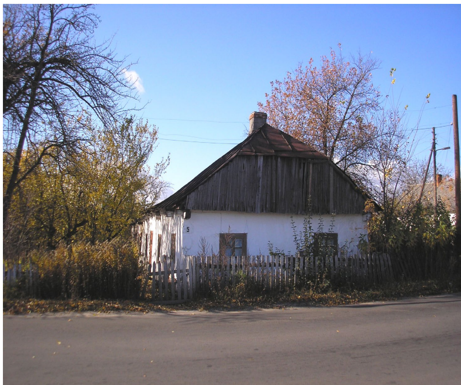
Одна з перших хат (побудована в 1916 р.)

Забудова Рафалівки розпочалася з 1902 року. Існує дві точки зору заснування цього населеного пункту. Перша, яку вважають основною-це що селище виникло в результаті будівництва залізничної станції, яку назвали роз'їзд Полиці і забудови місцевості залізничниками. Друга точка зору існує, але її не вважають основною: колись було два пана Рафалівський і Полицький. Одного разу, коли вони грали в карти, Полицький пан програв землю, а Рафалівський, вигравши цю землю, заснував населений пункт і назвав його Рафалівкою, на честь свого імені - Рафаїл. Напередодні 1914 року дерев'яний будиночок станції оточували кілька маленьких хат, де мешкали робітники-залізничники. Пізніше тут виросло робітниче селище.