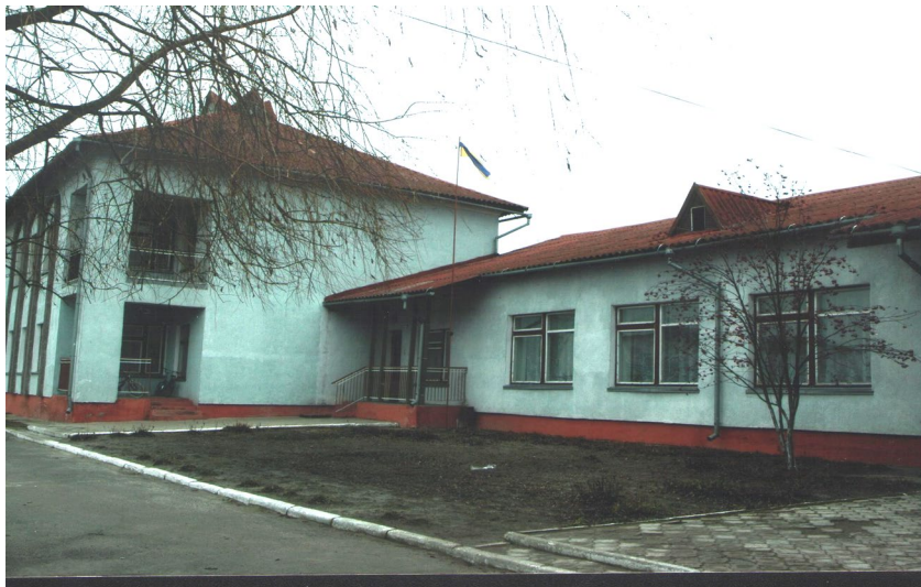
Школа ДНЗ НВК

Як бачимо, історія Рафалівки багата на події і факти, що свідчать про волелюбність її жителів. Я шаную своє селище, яке дихає історією, дає уявлення про велич і славу предків. Я поважаю добрі справи рафалівчан, які бережуть і примножують цінності рідного селища. Я пишаюсь тим, що я – рафалівчанин.