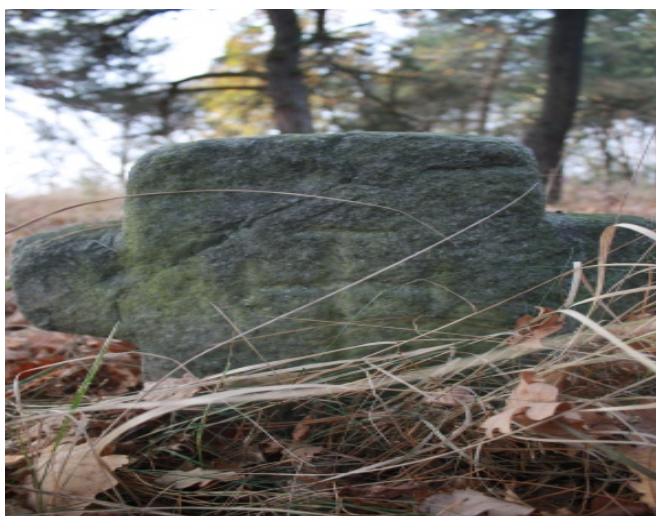
Рис.3 Кам'яні хрести