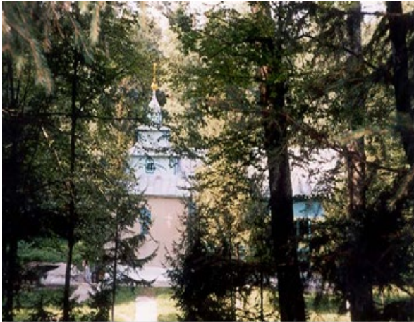
Рис 1 Джерело з капличкою

В лісі неподалік с.Городець є урочище «Тріщава». «Тріщава» відоме тим, що там б'є цілюще джерело, біля нього побудована капличка. На Купала там проходять Богослужіння. А поряд з джерелом росте дуб – велетень.