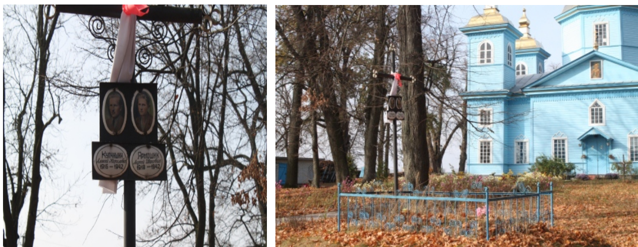
Рис.6. Могила у Городці.