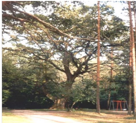
Рис. 2 Дуб – старожил

За народними переказами, Б.Хмельницький разом з козаками зупинялись біля джерела, пили воду і відпочивали під дубом. Кажуть, що багато сільських хлопців приєднались до козацького війська і пішли з ними в похід.