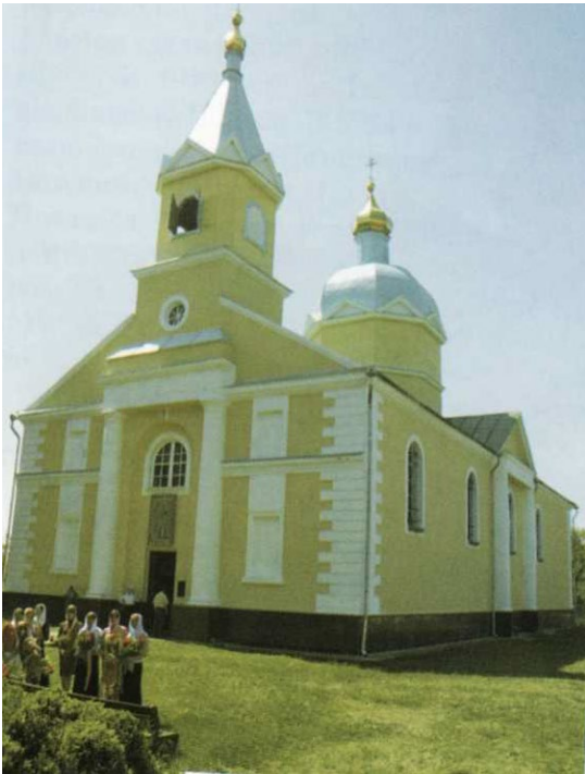
Село Стара Рафалівка, церква Св.Миколи кінець ХУІІІ ,головний фасад.

У лісовому краї північної Рівненщини, в центрі стародавнього с. Стара Рафалівка, відомого з другої половини ХVІІ ст., височить церква св. Миколи Чудотворця, збудована в останню третину ХVІІІ ст. [25, т. 3, с. 305]. Зведена як уніатська, на початку ХІХ ст. церква зазнала перебудов, метою яких було надання зовнішньому вигляду будівлі православних рис. Над геометричним центром храму зведено фальшивий дерев'яний верх на глухому підбаннику без вікон, увінчаний декоративною маківкою. Одночасно надбудовані) верхній, квадратний у плані (зі зрізаними кутами) дерев'яний ярус вежі- дзвіниці над центром нартекса, увінчаний восьмигранним волинського КРАЮ шатром і декоративною маківкою.