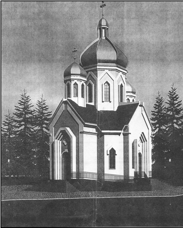
Майбутня Свято-Покровська церква