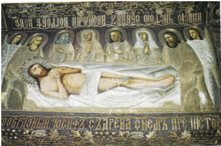
Плащаниця Ісуса Христа. Письмо, шиття золотом та сріблом. XIX ст.