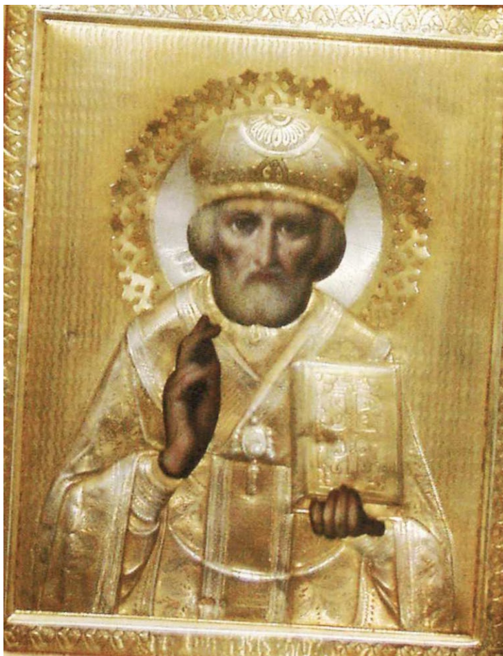
Храмова ікона св.Миколи Чудотворця. ХІХ ст.