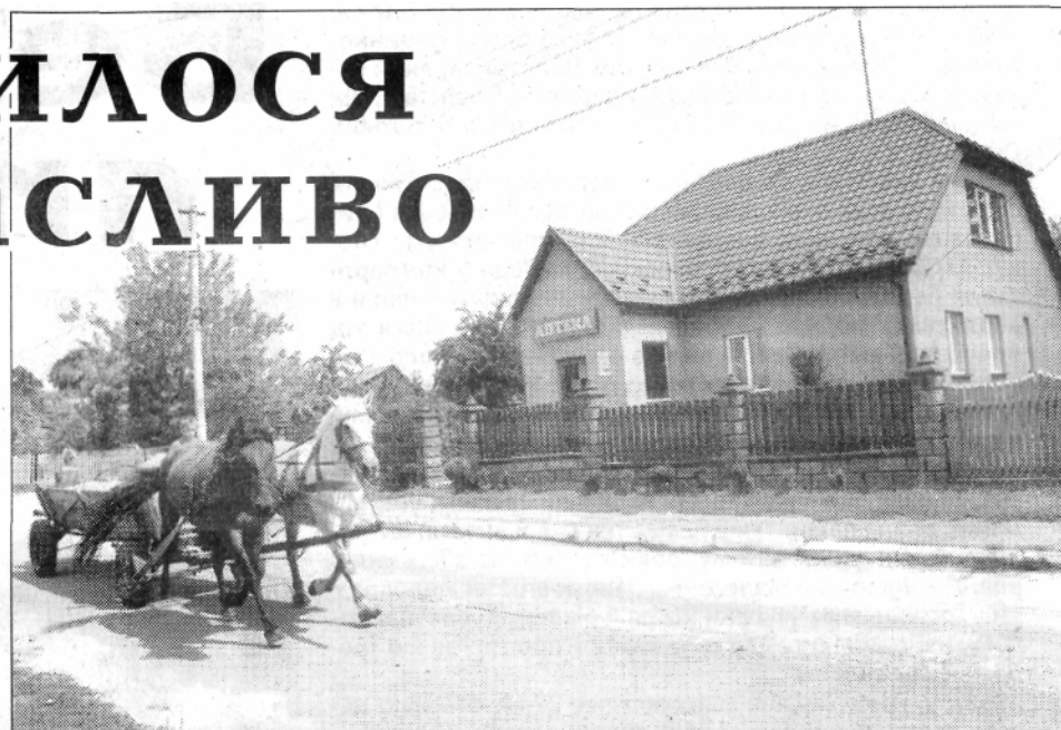
На одній з вулиць села.

Якщо порівняти Балашівку, скажімо, тридцятирічної давності, то нинішня справляє набагато краще враження. Сільвиконком в міру можливого дбає про благоустрій сільських вулиць, їх освітлення. І в центрі, і на околицях сонячно сяють просторими вікнами сучасні будинки з вишуканими огорожами та