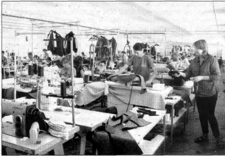
У швейному цеху підприємства.

ТОВ «Укленко» вже протягом чотирнадцяти останніх років є одним з найпотужніших швейних виробництв у нашому районі. В цехах підприємства нині трудиться більше двохсот працівників. Тут на сучасному обладнанні випускають різні види жіночого, чоловічого і дитячого одягу, зокрема, пальта, плащі та куртки. Власник швейної фабрики - французька фірма «Ленер Кордьє»- реалізує ці вироби у багатьох країнах Європи, в Америці, Китаї, Кореї та Японії.