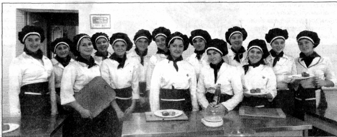
Хороший настрій у юних кухарів - майбутня професія їм подобається.