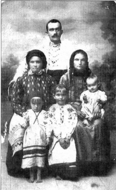
Родина ЧЕРНИШІВ. 1914 р.

На його долю в дитячі та юнацькі роки випало багато життєвих випробувань. Світлу і вразливу до добра і всього прекрасного душу не затьмарили важкі поневіряння в холоді і голоді. Сьогодні йому добігає восьмий десяток літ, але він такий жвавий і енергійний, як і колись. Він щасливий, що живе на своїй, українській, Богом даній землі. Пропоную вашій увазі спогади В'ячеслава Юсковця про своє життя.