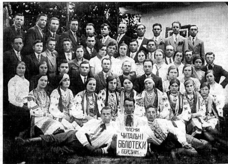
Просвітяни і громадські активісти. Початок 30-х років.