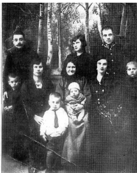
Родина ЮСКОВЦІВ по батьковій лінії. 1924 р.

і насамперед — небайдужість. Мені здається, що найкращі роки мого дитинства припали на 1940-1941 роки. Німці прийшли в Моквин в кінці червня в другій половині дня, в гарний сонячний день. До війни радянська влада позабирала радіоприймачі, щоб люди не слухали новин. З приходом німців батько пішов в Березне на пошту щоб забирати свій радіоприймач.