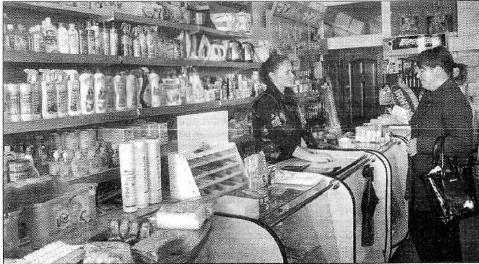
Великий асортимент товарів широкого вжитку представлено в приватному магазині "Мій світ".