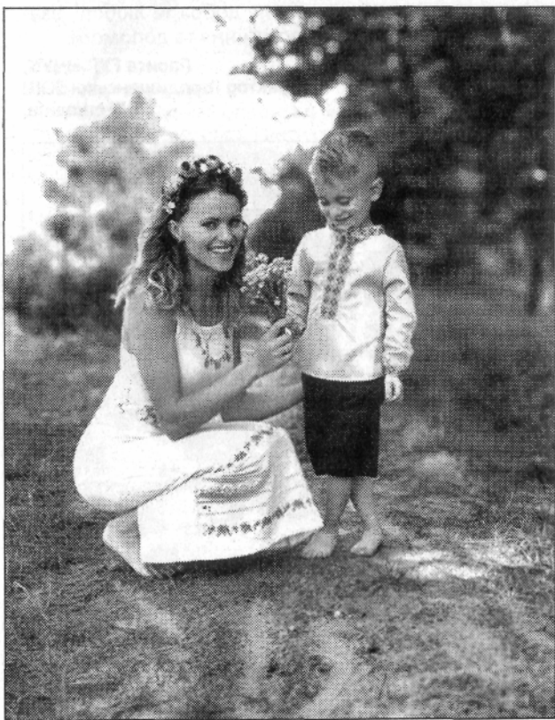
Квіти для мамі.

- Головне — не зупинятися, адже межі вдосконалення нема, - вважає вона. - Дозволю собі озвучити кіль-