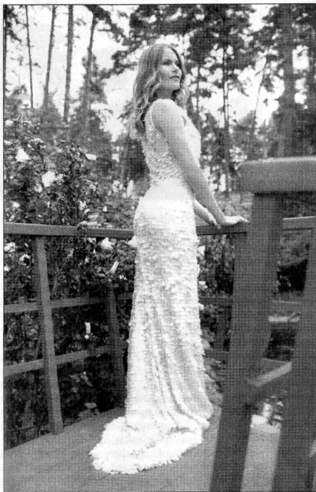
Як же личить Марійці ця вечірня сукня.

ка цитат, які мене мотивують: "Нескінченне прагнення бути кращим є обов'язком людини. Це вже саме по собі є винагородою". Ці мудрі слова належать Махатмі Ганді. А от Г. Торо вважає: "Кожна людина — будівник храму, що називається його тілом". Переконатися в цьому легко, досить тільки позбутися лінощів. Спорт має дивовижні властивості. Він об'єднує людей, знайомить їх між собою, зміцнює здоров'я, характер, навіть розумові здібності. От у Львові я познайомилася з Василем Вірастюком. Це не тільки один з найсильніших спортсменів сві-