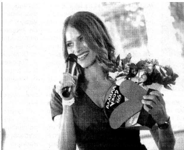
Премію "Мама року - 2018" вручено.