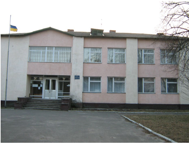
Яринівська сільська рада