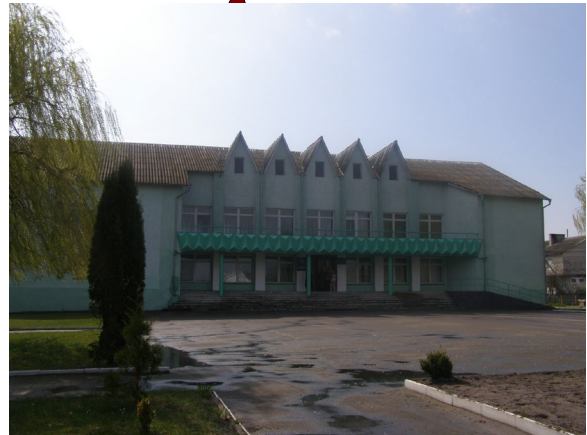
Яринівська ЗОШ І-ІІ ст.