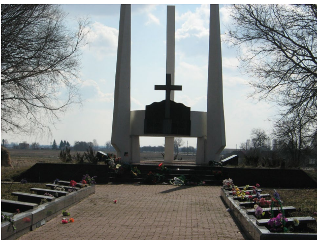
Меморіал загиблим односельчанам