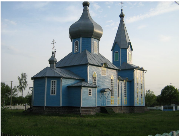
Храм Св. Параскеви