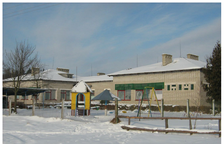
Яринівський ДНЗ «Сонечко»