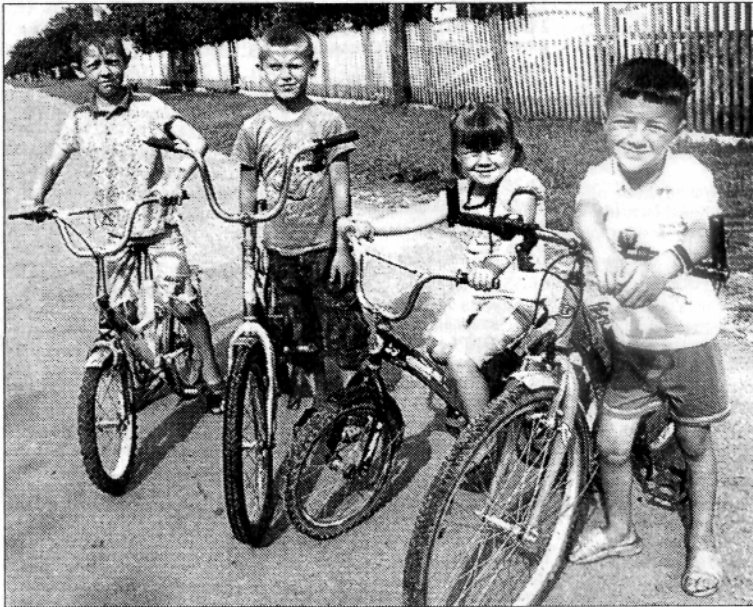
На старті юні велосипедисти.

– Не секрет, що в цьому селі практично немає робочих місць, то де заробляють собі на хліб антонівці? – запитую у С. Й. Парфенюк.